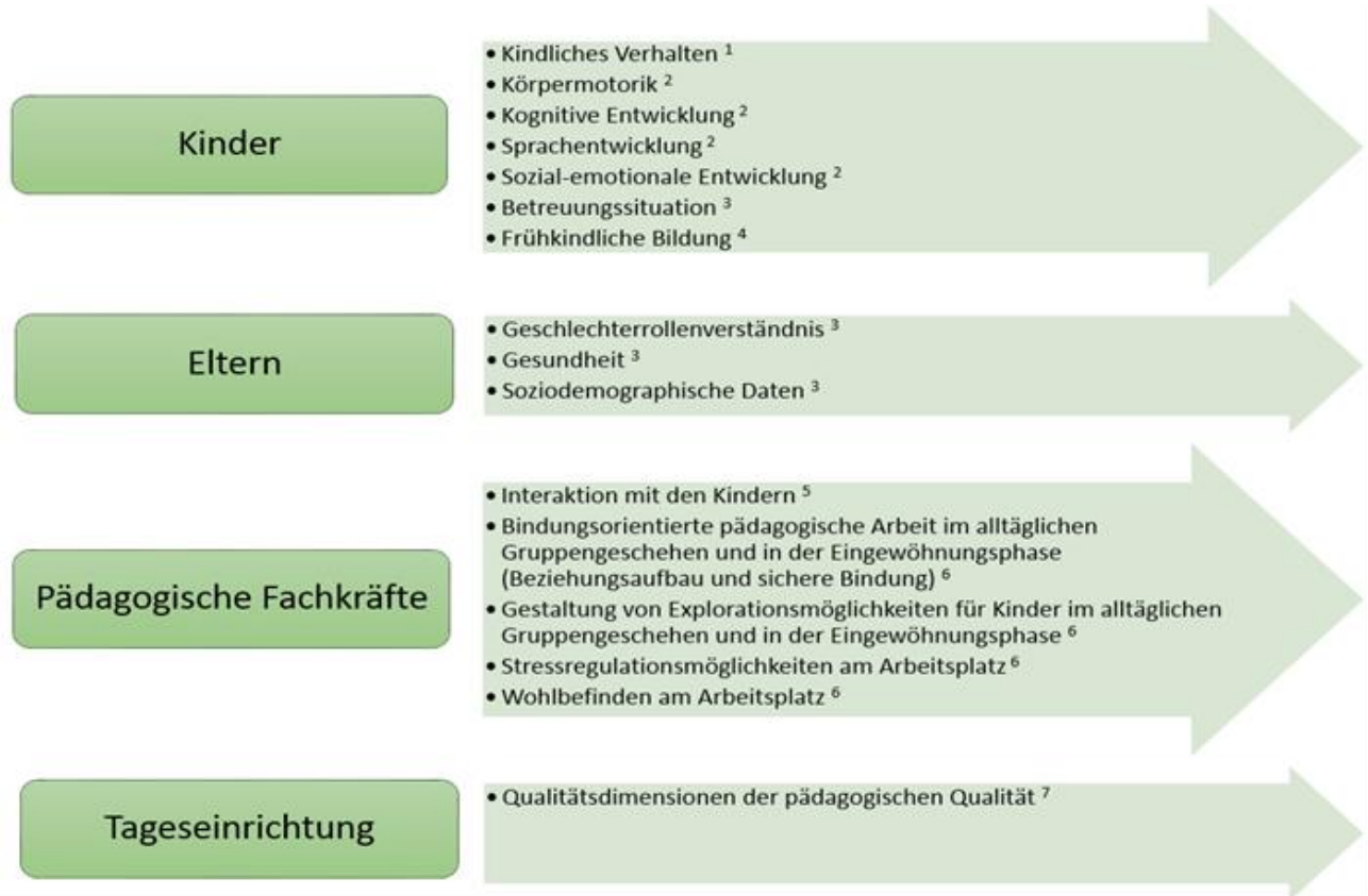
Abbildung 2: Verknüpfung der Forschungsinstrumente mit den Untersuchungsbereichen der Zielgruppen im Forschungsprojekt ‚Bildung durch Bindung‘

den Kinder, Eltern, pädagogische Fachkräfte sowie die Kindertageseinrichtung an der Untersuchung beteiligt. Abbildung 2 verknüpft die Forschungsinstrumente mit den Untersuchungsbereichen der Zielgruppen. Die abschließende Auswertung (3) dient der Formulierung von Praxisempfehlungen.