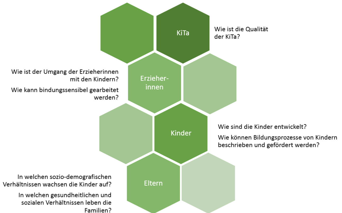
Abbildung 1: Zielgruppen und Untersuchungsbereiche im Forschungsprojekt 'Bildung durch Bindung'

Vor dem Hintergrund der vertretenen Professionen im Forschungsteam (Erziehungswissenschaften, Soziale Arbeit und Sozialpädagogik, Gesundheits- und Sozialwissenschaften, Soziologie) und dem Stand von Forschung und Wissenschaft (2015-2017) ergaben sich zu Projektbeginn folgende Zielgruppen und Interessensbereiche (Abbildung 1):